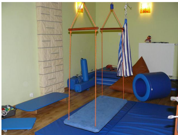
Sala do terapii zaburzeń Integracji Sensorycznej